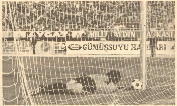
Den von Weber geschossenen Ball bekam der türkische Schlussmann Eser erst hinter der Torlinie zu fassen, doch der italienische Unparteiliche versagte diesem regulär erzielten Treffer unverständlicherweise die Anerkennung. Hier bahnt sich diese Situation an.

Die WM-Qualifikationsspiele am vergangenen Mittwoch: Im Pariser Prinzenpark-Stadion bewies der Gastgeber beim 3 : 1 über Bulgarien Spielwitz und Angriffsstärke ● England beherrschte die Squadra Azzurra in Wembley eindeutig, doch mit 2 : 0 fiel das Resultat enttäuschend aus ● Überraschend sicherer 3 : 0-Erfolg Nordirlands über die wiederum zusammenhanglos operierenden Belgier ● Portugal beim 4 : 0 über Zypern ungefährdet, Europameister CSSR auch beim 1 : 0 gegen Wales von der 76er Bestform noch ein ganzes Stück entfernt.