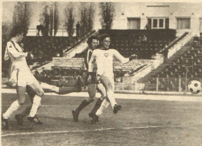
Der BFC Dynamo kam auch in seinem sechsten Heimspiel nicht zum ersten Doppelpunktgewinn auf eigenem Platz. Hier verfehlt Sträßer das gegnerische Gehäuse.