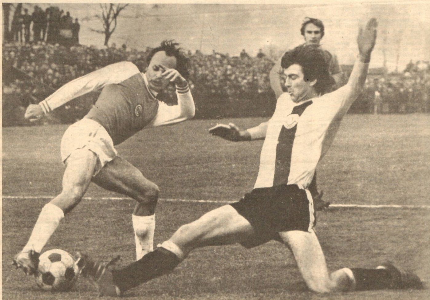
Respekt kannte Neuling Chemie Böhlen gegen den Meister nicht! Hier versucht sich Hubert (links) gegen V. Schmidt durchzusetzen.

Kampfstärke Böhlener Chemie-Elf trotzte Dynamo Dresden ● Den einzigen Heimsieg der 10. Runde verbuchte der BFC Dynamo ● Zwickau brachte aus Gera zwei wichtige Punkte mit nach Hause ● Devise für Jena und den 1. FCM: Form für Spiele im UEFA-Cup steigern!